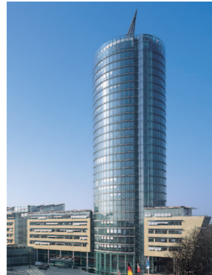
Centrála ERGO v Düsseldorf

ERGO operuje na trhu pod vlastným menom, ako aj pod značkami svojich špecializovaných poisťovní. Značka ERGO sa využíva najmä v oblasti životného a majetkového poistenia. Túto značku dopĺňa na celom svete známa D.A.S., poisťovňa právnej ochrany, ďalej zdravotné poistenie DKV v Nemecku a medzinárodné cestovné poistenie ERV. Klientom je k dispozícii viac ako 50 000 interných a externých obchodných zástupcov, zamestnanci priameho predaja, agenti, brokeri a silní partneri nielen doma, ale aj v zahraničí. ERGO nadviazala rozsiahlu spoluprácu v oblasti predaja s poprednou európskou bankou UniCredit Group v strednej a východnej Európe.