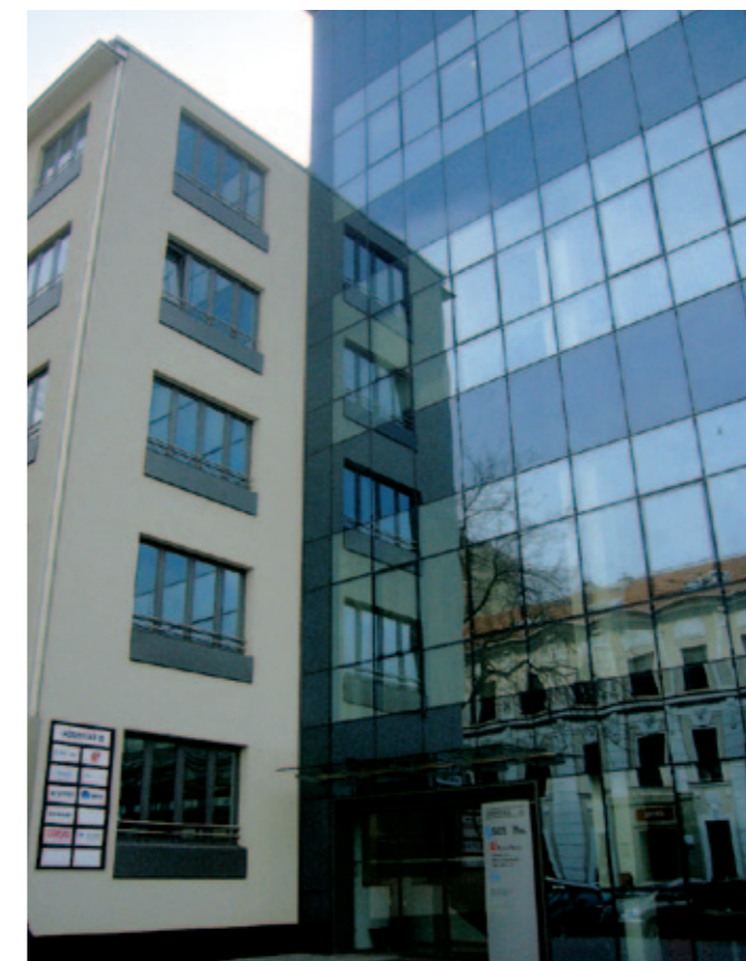
Sídlo ERGO životná poisťovňa, a.s. v Bratislave

All paths cross at ERGO Austria. As the CEE hub of the Group's bancassurance activities, ERGO Austria is the meeting point for the provision and exchange of know-how and expertise. ERGO Austria ensures that we are kept up to date on the latest ventures undertaken by our sister companies in Hungary, Slovakia and Slovenia. We thus benefit from ERGO Austria's excellent know-how transfers: in our marketing activities, for intensified sales and for product optimisation. Besides that, the ERGO Group organises special events for all aspects